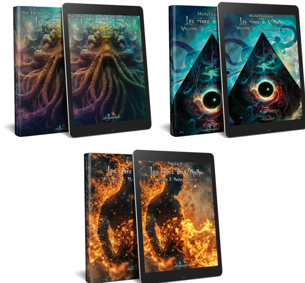
Les rêves de Cthulhu – Volume 1 : Ailleurs et au-delà

La collection « Les rêves de Cthulhu » se compose actuellement de 3 titres, disponibles en livre broché ou en ebook :